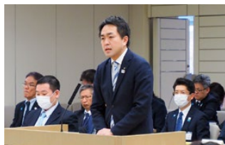
条例案を説明するため答弁する様子