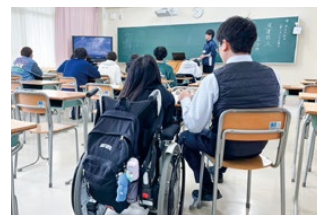
特支と一体的な運営の阪神昆陽高校