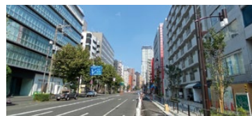
無電柱化した山手通り